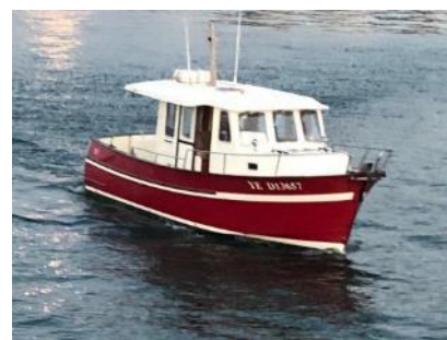
Le bateau de Philippe dans lequel vous ferez, en général, la traversée

Le port du Conquet (oui oui, toujours sous le soleil! 😊) avec le point de rendez-vous numéro 1 et le point de rendez-vous alternatif numéro 2